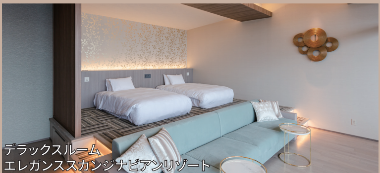
デラックスルーム エレガンスカンジナビアンリゾート

自然の中にある草花などをモチーフにしたボタニカル風な空間。古民家のようなリラックス感の中に遊び心を感じてください。