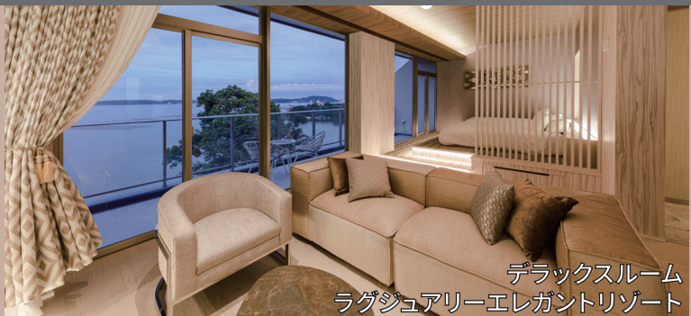
デラックスルーム ラグジュアリーエレガントリゾート

奥浜名湖の雄大なレイクビューはもちろん、テラスやジャグジーバス付のお部屋やご夫婦から3世代のご家族まで幅広いニーズに応じられるゲストルームを完備しております。