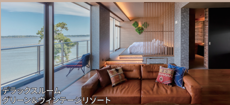
デラックスルーム グリーン&ウィンテージリゾート

パールグレーの木目を基調とし、リラックス感のある植物柄や円形のモチーフを配し、洗練されたリゾート感を表現。