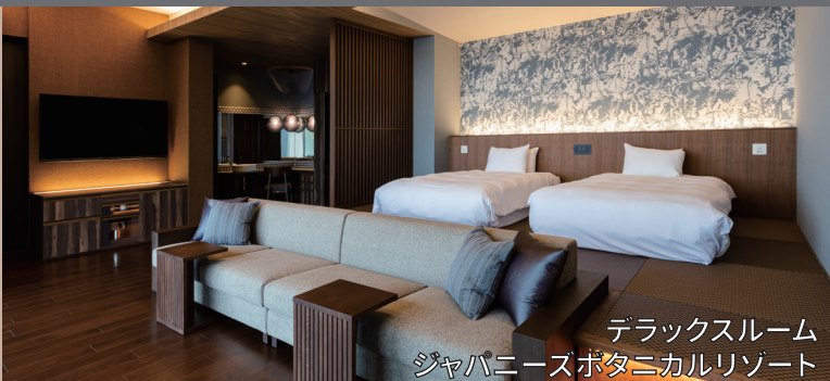
デラックスルーム ジャパニーズボタニカルリゾート

グリーン・アイボリー・ベージュを基調としたフェミニンでエレガンスな空間。アクセントカラーのゴールドやシャンパンゴールドを配し、ラグジュアリー感あふれる客室。