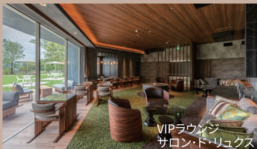
VIPラウンジ サロン・ド・リュクス