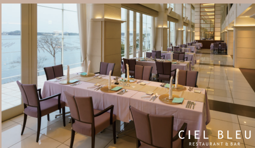
CIEL BLEU RESTAURANT & BAR