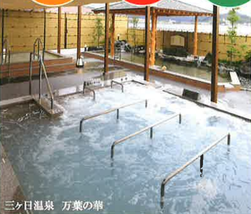
三ヶ日温泉 万葉の華