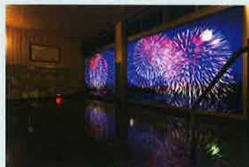
三ヶ日温泉「万葉の華」