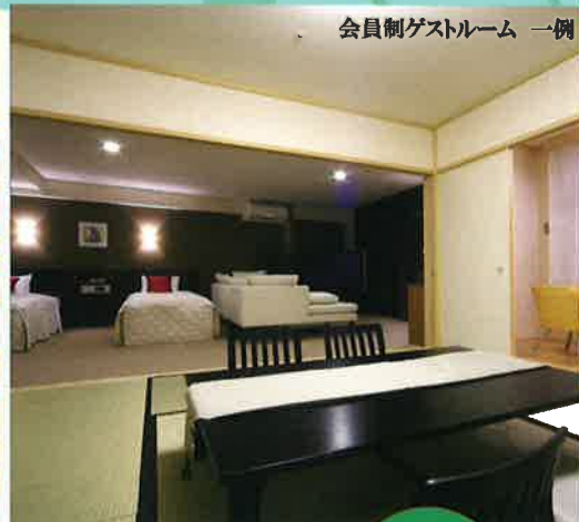
会員制ゲストルーム 一例