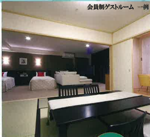
会員制ゲストルーム 一例