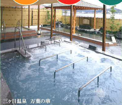
三ヶ日温泉 万葉の華